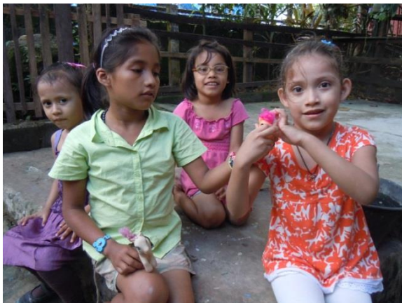
Kinder unseres Projekts in Bluefields

Der Nicaragua-Verein wurde im Juli 2003 gegründet und ist seit September 2003 vom Finanzamt Ettlingen als gemeinnützig anerkannt. Durch persönliche Begegnungen in Nicaragua entstanden, hat der Verein das Ziel, jungen Menschen aus sozial zerrütteten Familien ein Leben in geordneten Verhältnissen zu ermöglichen, vor allem schulische Bildung . Der Verein unterstützt die Hermanas Misioneras Franciscanas , eine kleine franziskanische Schwestern-Kommunität, die ein Kinderheim in Bluefields (Stadt an der Ostküste) unterhält. Seit 2002 haben schon einige Abiturientinnen des Gymnasiums ein FSJ oder Praktikum in diesem Kinderheim absolviert. Ohne die finanzielle Unterstützung durch den Verein könnte das Kinderheim nicht existieren.